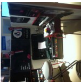
Equita Lyon 2015 – EQUINAIL